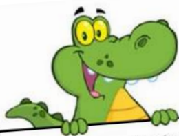
Fiel de spelletjeskrokodil

We wensen hen héél veel succes in het middel- baar! Komen jullie vol- gend jaar nog eens een bezoek- je brengen aan onze school?